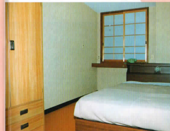
シングル(セミダブル)