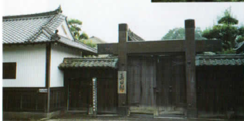
▲日本電信発祥の地